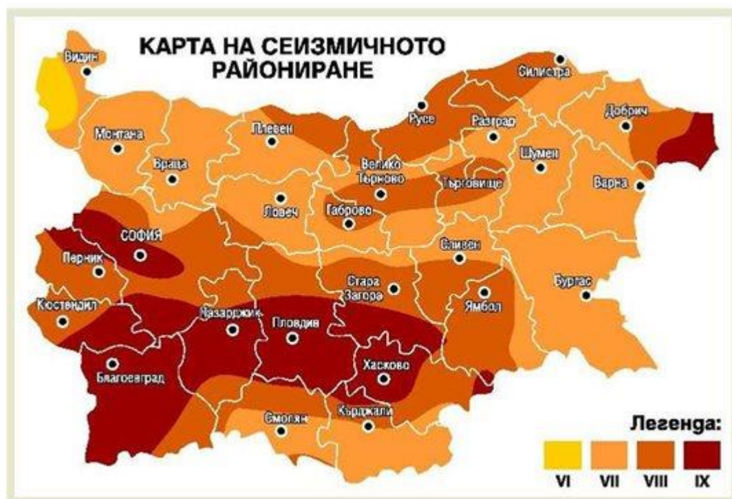
Таблица. Вероятност за възникване на земетресения на територията на област Ямбол на база повтораемост на земетресенията за последните 100 години

Територията на Ямболска област попада към Средногорския район в Маришко –Тунджанската зона. Най-силното земетресение с епицентър Ямбол е регистрирано на 15.02.1909 г. - магнитуд 5,9. Според картата на сеизмичното райониране на територията на област Ямбол са възможни земетресения с максимална интензивност VII-ма и VIII-ма степен по скалата на Медведев – Шпонхойер – Карник (МШК-64) и максимален